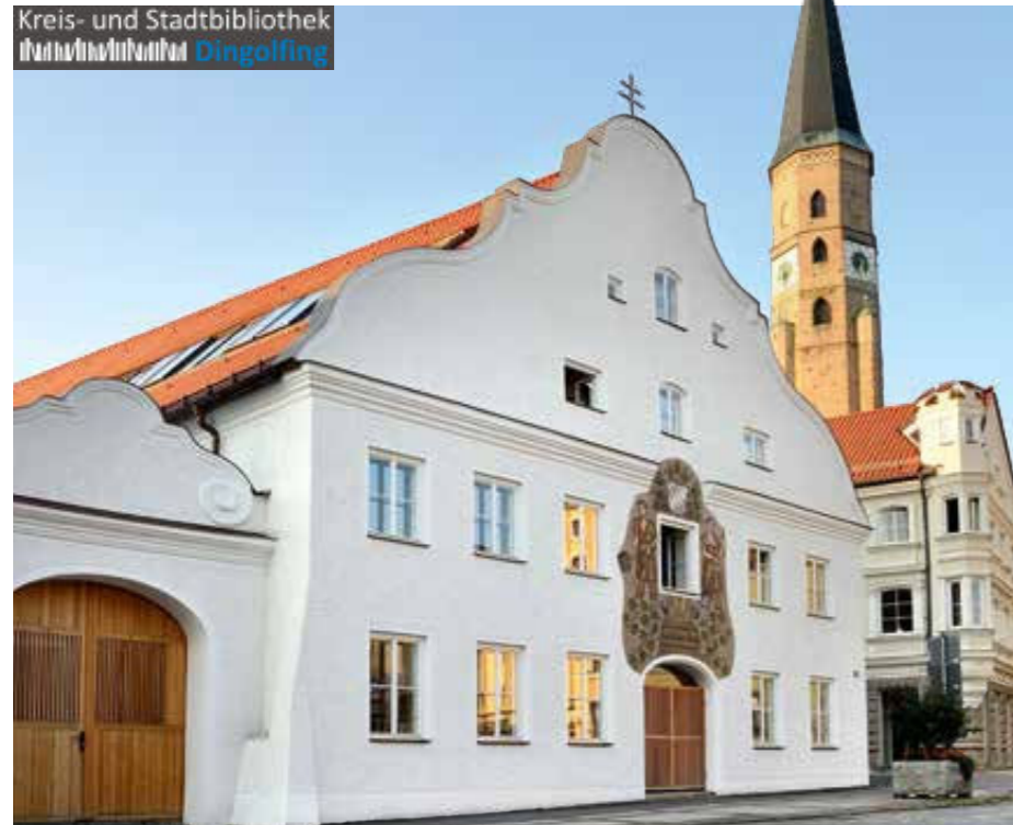
Kreis- und Stadtbibliothek Dingolfing