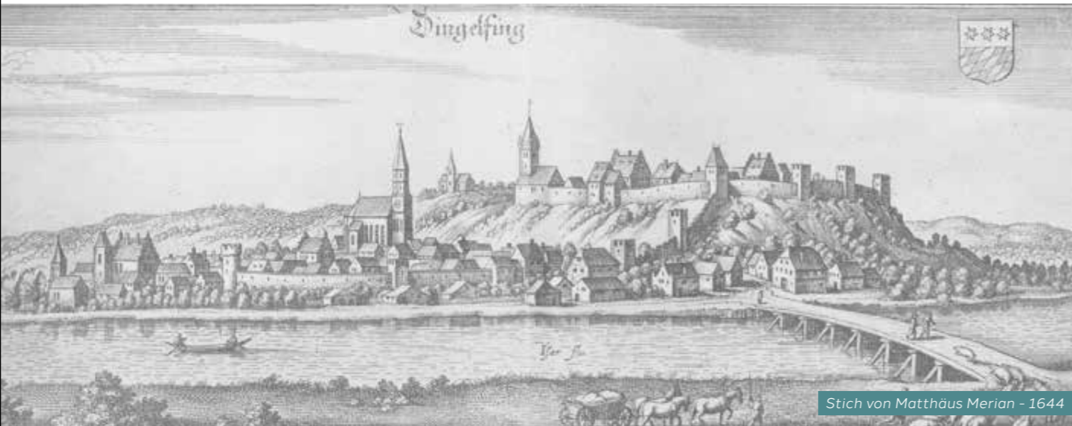
Stich von Matthäus Merian - 1644