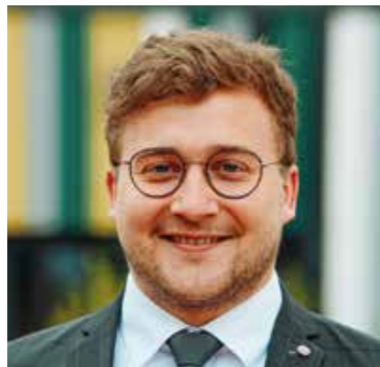
3. BGM Valentin Walk - CSU